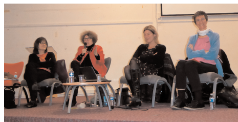
Lors du thème Femmes et création

rendre compte des différents contextes européens. Puis l'après-midi a été consacré à la