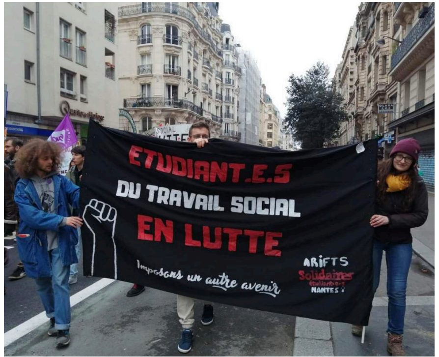
Cortège nantais du 31 janvier, une banderole digne de la #battledebanderole !

Dans les manifestations, les cortèges se multiplient. Le cortège permet de visibiliser dans la mobilisation d'une entreprise, un service ou un secteur tout entier. Le 31 janvier, Sud industrie avait formé dans la manifestation parisienne un cortège Automobile avec ces équipes de Renault, Lardy et Stellantis. Chaque manifestation est l'occasion d'un grand cortège Enseignement Supérieur et Recherche qui permet d'avoir de beaux cortèges d'étudiant-e-s, et de lycéen-ne-e-s. On saluera aussi les cortèges féministes, comme celui des chorales féministes à Toulouse ou celui des Rosies qui a sa place dans le cortège de Solidaires à Paris. Enfin depuis le 31 janvier, on note la présence de cortège chômeurs, intermittents et précaires au moins à Paris et Toulouse regroupant autour d'organisations syndicales comme Sud Culture, le DAL (droit au logement), le MNCP (mouvement national des chômeurs et précaires) ou encore la CIP (coordination intermittents et précaires). La diversité des cortèges nous rappelle à quel point l'opposition est forte et diverse contre la réforme!